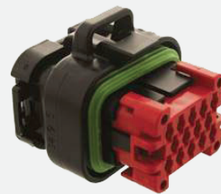
Câble adaptateur CLAAS-S10