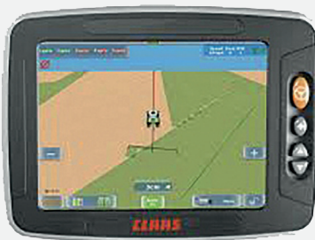
Terminal S10 - 1 entrée vidéo