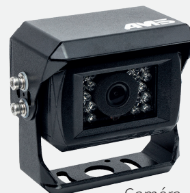
Caméra AMS - X4