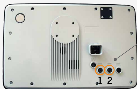
Dos du Terminal DSM

Le raccordement caméra se situe au dos du terminal.*