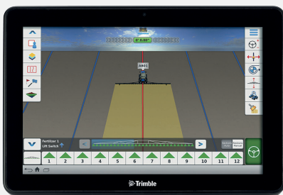
Terminal TMX - 2050 (XCN - 2050) - 1 entrée TRIMB2 et 1 entrée TRIMB1