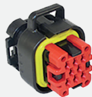
Câble adaptateur TRIMB 2