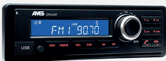
CT412-BT ou CT412-DAB-BT