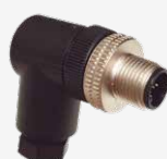
Cavo adattatore MC-DSM