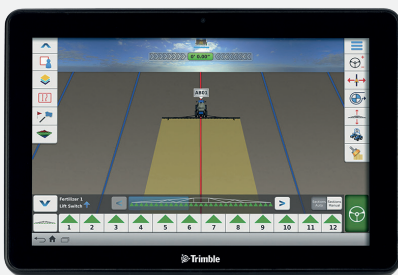
TMX - 2050 (XCN - 2050) - 1 entrada de vídeo TRIMB2 et 1 entrada de vídeo TRIMB1