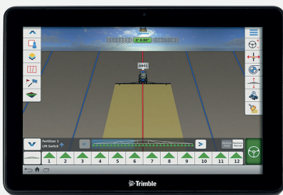
TMX - 2050 (XCN - 2050) - 1 video ingang TRIMB2 et 1 video ingang TRIMB1