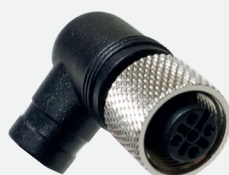
VT TRACTOR 1 (2m)