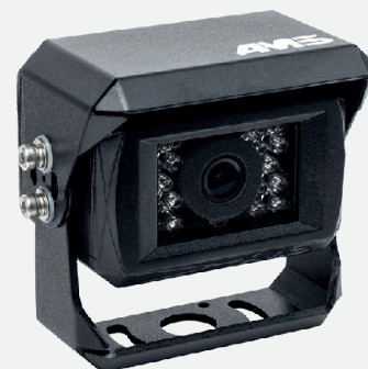
Cámara AMS *

El cable adaptador VT TRACTOR1 permite equipar la pantalla SmartTouch en las máquinas Valtra.