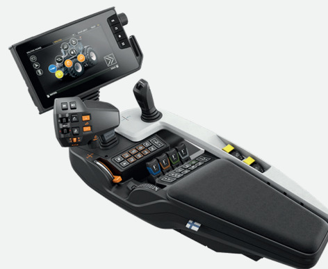
Reposabrazos Smart Touch

→ Serie N / Serie T / Serie S / Serie G (solamente para acabados VERSU)