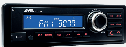
CT412 BT o CT412 DAB BT