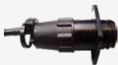
Adapterkabel NHL COMB3 MC