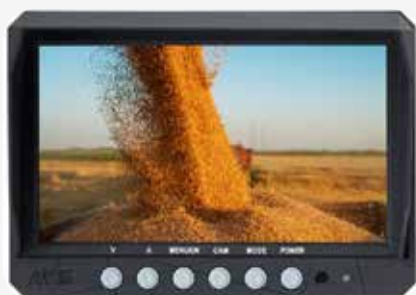
Monitor AMS M7 / MS7 / M9 / MS9