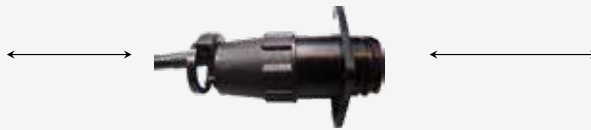
Cavo adattatore NHL COMB3 MC