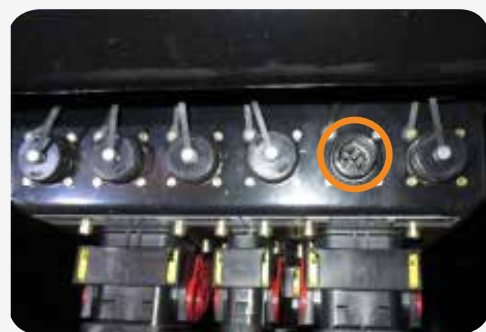
(C2 7pin maschio)

Staccare il quinto connettore : cavo video della telecamera originale sulla macchina