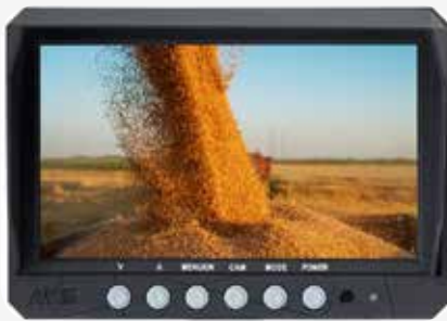
Monitor M7 / MS7 / M9 / MS9