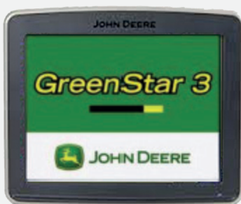
GREENSTAR 2630 1 ingresso video