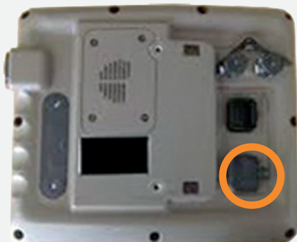
GREENSTAR 2630 1 ingresso video