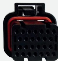
Cavo adattatore JD COMBINE