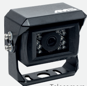
Telecamera AMS* (x3)