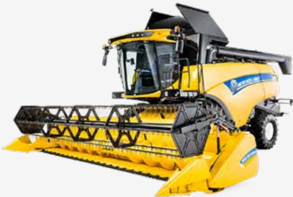
1. Mietitrebbia CX 5 e 6 TIER 4B

Cavo adattatore che permette di installare una telecamera AMS su monitor IntelliView IV sulla mietitrebbia New Holland :