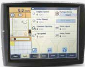
INTELLIVIEW IV (Secondo monitor IntelliView in opzione)