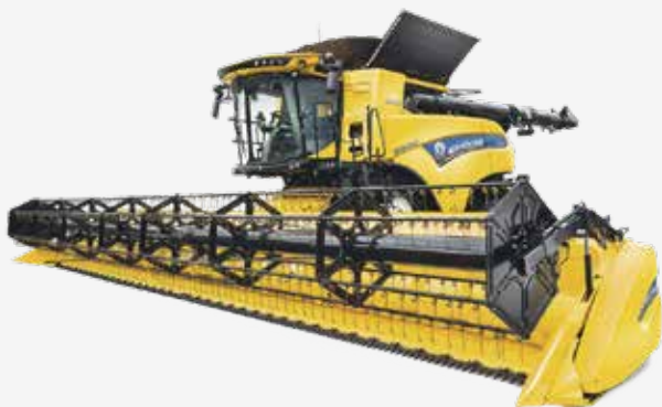
3. Moissonneuse CR7, 8, 9 e 10 REVELATION

* ATTENZIONE : Telecamera e monitor originale non incluso. Tutte le nostre telecamere AMS sono compatibili con questo cavo dedicato.