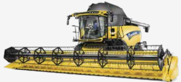
2. Mietitrebbia CX7 e 8 TIER 4B