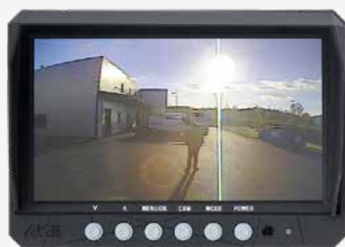
Visione esposta al sole