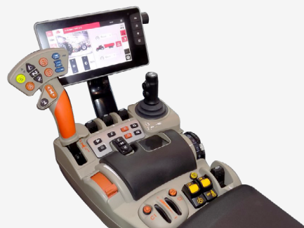
Accoudoir DATATRONIC 5 (1 entrée vidéo)