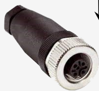
Câble adaptateur MF TRACTOR4-MC