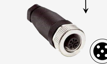
Cavo adattatore VICAM-AMS-MF-TRACTOR4-MC