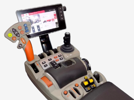
Bracciolo DATATRONIC 5 (1 ingresso)