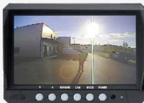
Vision face au soleil