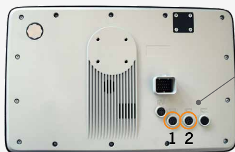
Dos du Terminal DSM

Le raccordement caméra se situe au dos du terminal.*