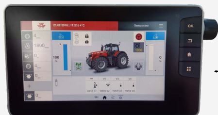
Terminal FIELDSTAR5 DATATRONIC5 ( Tracteur 5S)

Le câble adaptateur MF TRACTOR2 permet d'équiper une caméra AMS sur le terminal DATATRONIC4 des tracteurs Massey Ferguson.