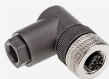
Câble adaptateur MF TRACTOR 2