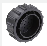
Câble adaptateur AGL INTEGRA