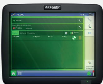
Terminal AG LEADER INTEGRA ou VERSA 1 entrée vidéo