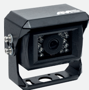
Caméra* AMS (x4)