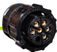
Câble adaptateur NHL TRACTOR3