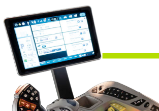
Terminal IntelliView 12*