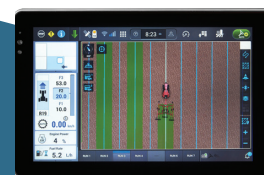
COMPATIBLE AVEC LES MONITEURS AFS PRO 700*