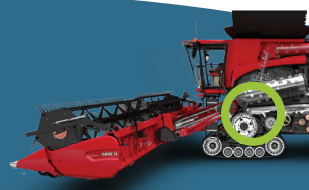
BRANCHEMENT : TUBE DE VIDANGE, HOTTE ARRIÈRE, TANK À GRAINS (EN REMPLACEMENT DE LA CAMÉRA D'ORIGINE)