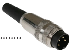
CÂBLE ADAPTATEUR NHL TRACTOR 4