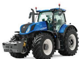
GAMME T7 (HD...)

COMPATIBLE AVEC LES MONITEURS INTELLIVIEW™ 12 D'ORIGINE DES MACHINES :