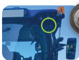
BRANCHEMENT À L'ARRIÈRE EN HAUT À DROITE (EN REMPLACEMENT DE LA CAMÉRA D'ORIGINE)