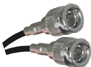
CÂBLE ADAPTATEUR NHL TRACTOR 5

COMPATIBLE AVEC LES MONITEURS INTELLIVIEW 12