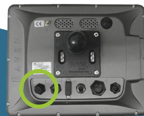
COMPATIBLE SUR LES MONITEURS RAVEN CR12, VIPER 4 ET VIPER 4+