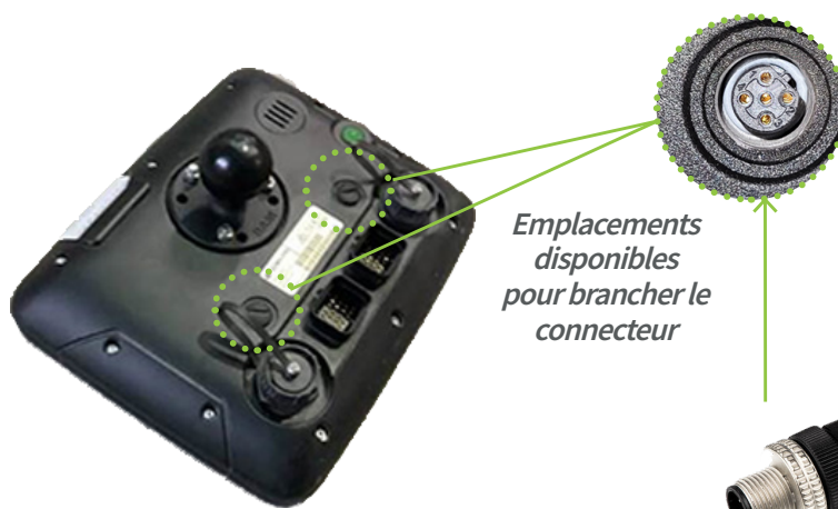
Dos du moniteur

Emplacements disponibles pour brancher le connecteur