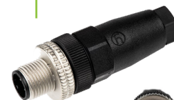
Câble adaptateur VICAM-AMS-TOPCON1

Emplacements disponibles pour brancher le connecteur